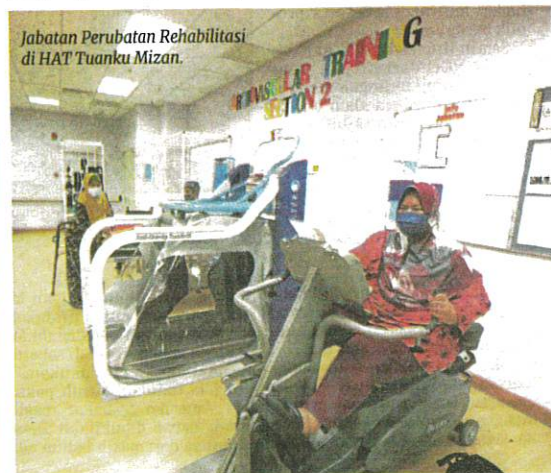
Jabatan Perubatan Rehabilitasi di HAT Tuanku Mizan.