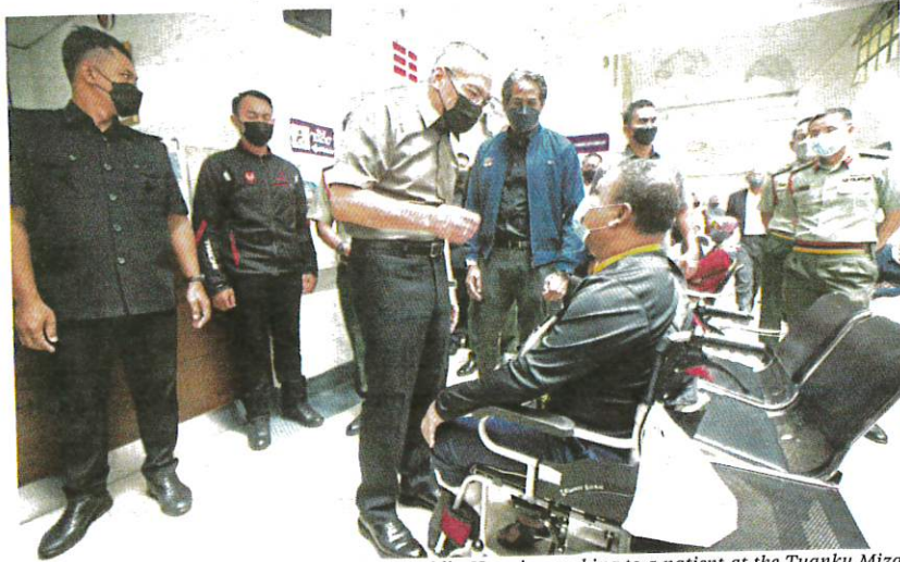
Senior Defence Minister Datuk Seri Hishammuddin Hussein speaking to a patient at the Tuanku Mizan Armed Forces Hospital in Wangsa Maju in Kuala Lumpur yesterday. With him is Health Minister Khairy Jamaluddin (fourth from left).

"The Armed Forces will also purchase two additional field hospital units at a total cost of RM47 million.