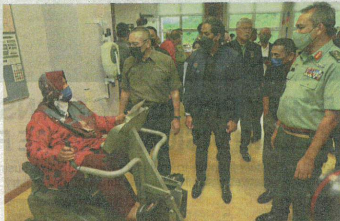
On the ground: (from left) Hishammuddin and Khairy visiting Tuanku Mizan Military Hospital, Kuala Lumpur.

Hishammuddin also announced that two field hospitals will be purchased at a cost of RM47mil, as well as 40 new field ambulances.