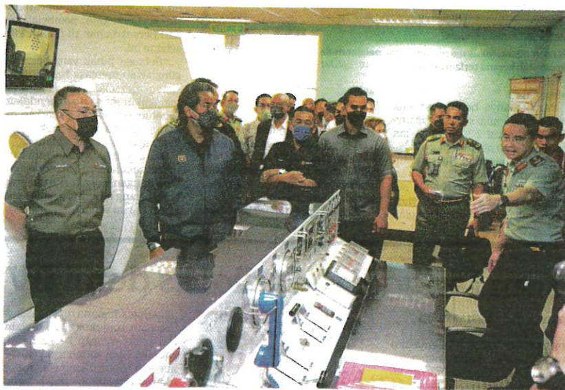
HISHAMMUDDIN (kiri) melawat dan meninjau fasiliti dan kemudahan Jabatan Perubatan Hiperbarik, Hospital Angkatan Tentera Tuanku Mizan, Wangsa Maju di Kuala Lumpur semalam.

Pada masa sama, Suruhanjaya Pencegahan Rasuah Malaysia (SPRM) memaklumkan telah melengkapkan kertas siasatan terhadap beberapa individu yang mempunyai kaitan dengan dakwaan penyelewengan dalam pengendalian projek pembinaan LCS.