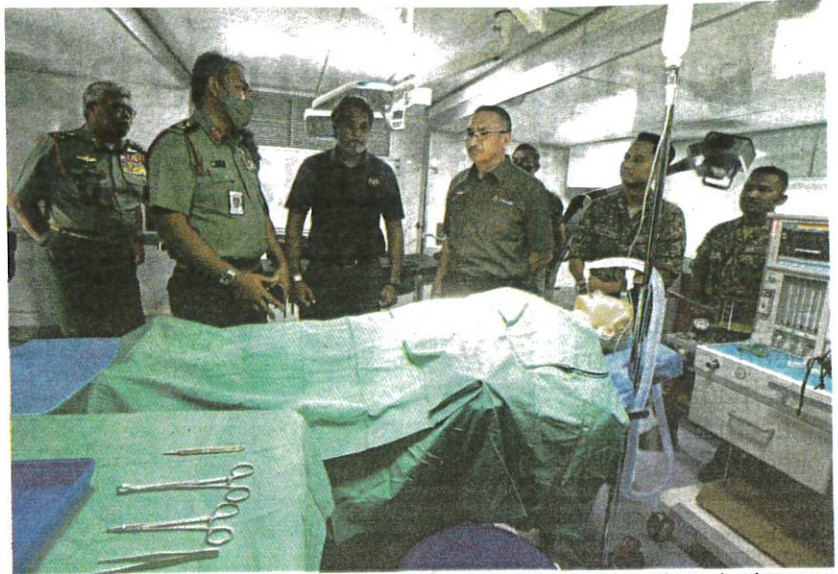
Hishammuddin (empat dari kiri) bersama Khairy melihat kemudahan dewan pembedahan bergerak pada Program Inisiatif Kesihatan di Kuala Lumpur, semalam.

Hishammuddin berkata, pelaksanaan inisiatif berkenaan turut membabitkan kerja penyelenggaraan dan penambahbai-