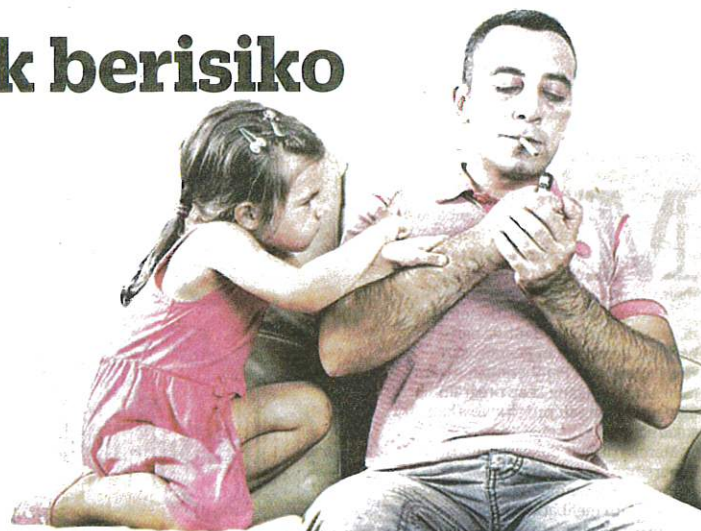
BAPA yang aktif merokok boleh membahayakan bukan sahaja anaknya, tetapi juga generasi selepas itu. – GAMBAR HIASAN