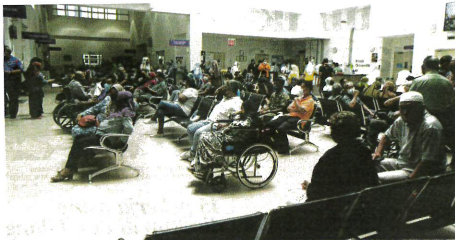
SEBAHAGIAN pesakit menunggu giliran di Jabatan Pesakit Luar sempena Program Inisiatif Kesihatan HAT Tuanku Mizan.