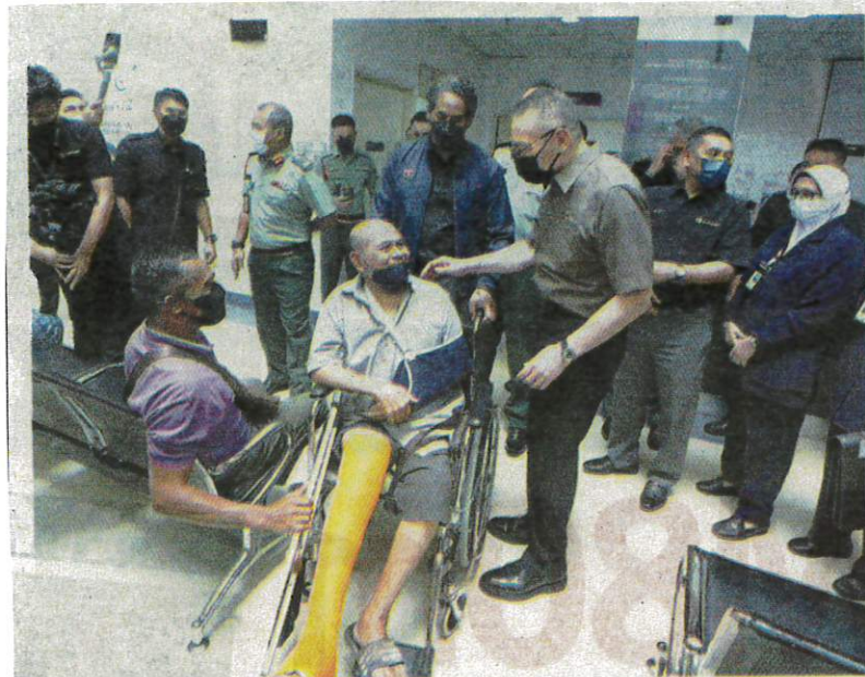
Hishammuddin and Health Minister Khairy Jamaluddin speaking to patients at the Tuanku Mizan Armed Forces Hospital in Kuala Lumpur yesterday.