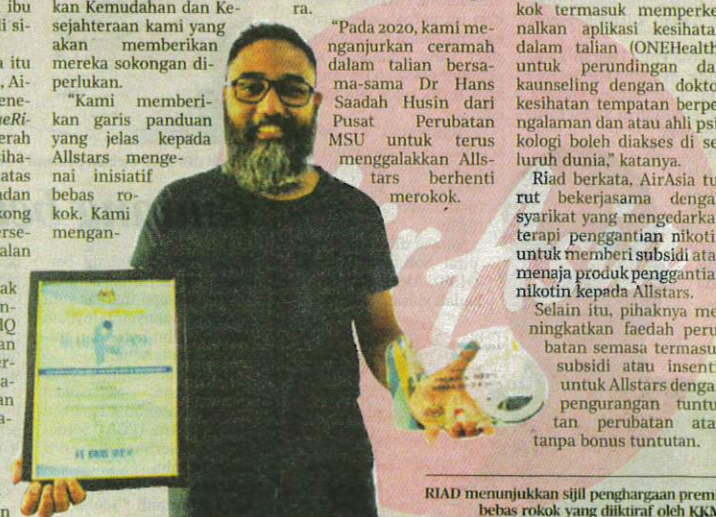
RIAD menunjukkan sijil penghargaan premis bebas rokok yang dikira oleh KKM.

Selain itu, pihaknya meningkatkan faedah perubatan semasa termasuk subsidi atau insentif untuk Allstars dengan pengurangan tuntutan perubatan atau tanpa bonus tuntutan.